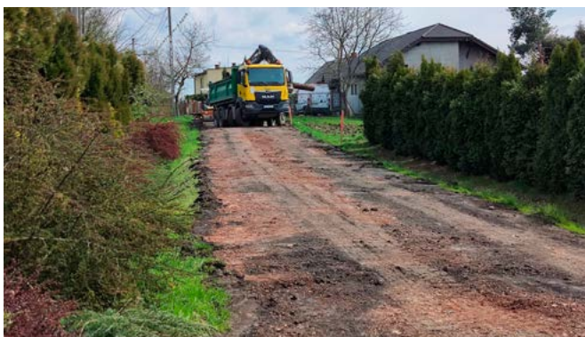
ul. Graniczna w Bestwinie i w Janowicach