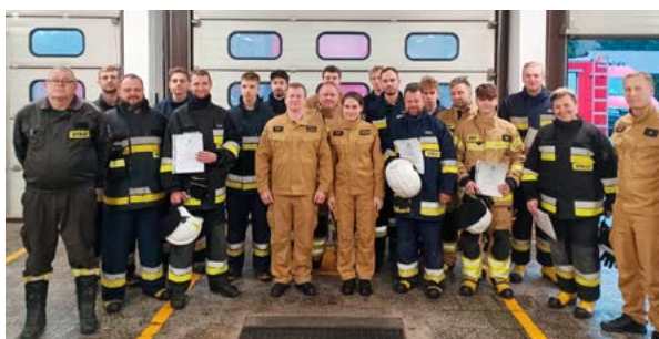
Strażacy uczestniczący w kursie

Wśród tych piętnastu kandydatów była jedna kobieta i jeden obywatel Ukrainy, który