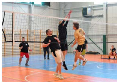
Walka pod siatką

wie podkreślali, że całe zawody cechowała bardzo miła i przyjazna atmosfera, w duchu strażackiego „fair play”.