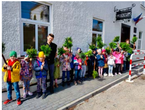
Uczestnicy zajęć z bestwińskimi palmami

wana jedynie kwiatami trzciny. Szanujący się gospodarz dodawał do palmy symbolizujące cierpienie jałowiec, bazie oznaczające nowe życie, leszczynę (zdrowie, długie życie), ślębę (krew Chrystusa), trzmielinę pospolitą (drzewo graniaste), czarną sosnę, żywotnik (tuję). W Wielką Sobotę główinki palmowe opalano w ogniu przy kościele, a popiół służył do posypania głów w Środę Popielcową. Z pozostałej leszczyny i ślęby robiono krzyżki wtykane pod pierwszą zaoraną skibę albo w cztery rogi obejścia. Kwiatostany wierzby (bazie kotki) niekiedy spożywano, co miało chronić przed chorobami gardła.