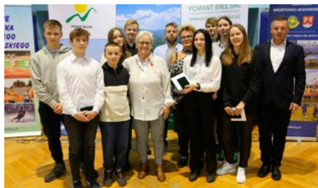
Reprezentacja sportowców z gminy Bestwina

Wiele polskich powiatów przyznaje nagrody dla swoich utalentowanych sportowców, którzy osiągnęli wybitne wyniki na zawodach krajowych i międzynarodowych. Celem tych wyróżnień jest nie tylko uhonorowanie osiągnięć sportowców, ale również zachęcenie innych do podążania śladami tych, którzy osiągnęli sukcesy w swoich dziedzinach. W przypadku gminy Bestwina jest się na kim wzorować, w samym kajak-polo kolekcja tytułów oszałamia i motywuje do dalszych startów.