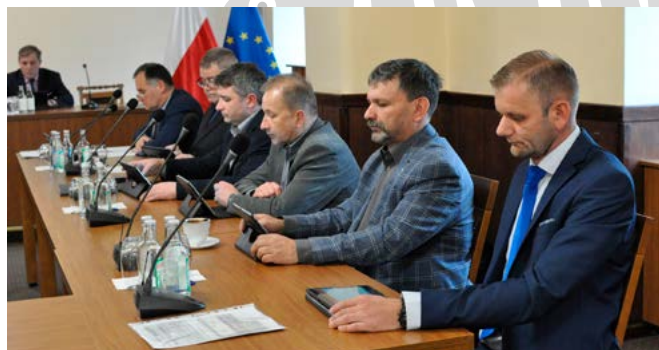
Radni podczas podejmowania uchwał