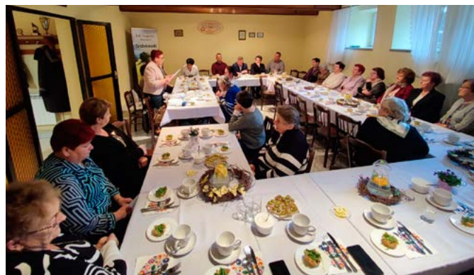
Zebranie odbyło się w siedzibie KGW w budynku OSP Bestwina