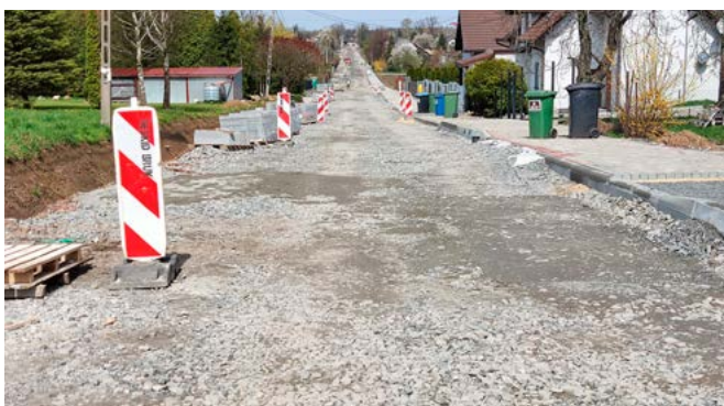
ul. Sportowa w Bestwinie