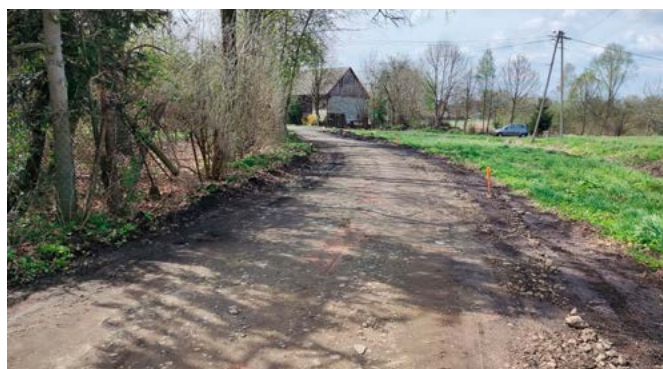
Kaniów, ul. Mirowska