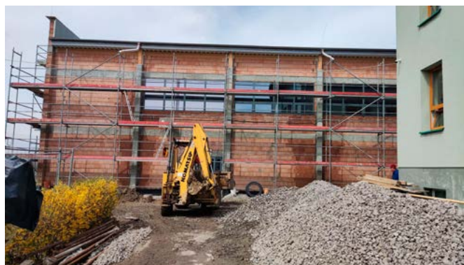
Hala sportowa w Janowicach