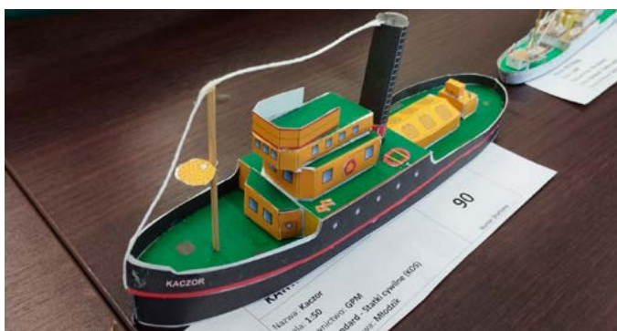
Nagrodzony model statku

W dniach 1–2.04.2023 roku nadmorska Reda przywitała po raz kolejny modelarzy, którzy zaprezentowali swoje małe dzieła w II Festiwalu Modeli Kartonowych. Blisko 300 modeli w kilkunastu klasach walczyło o najwyższe trofea i miejsca na podium. Bardzo wysoki poziom prezentowanych prac wzbudzał wielkie zainteresowanie publiczności. W wydarzeniu wzięli udział