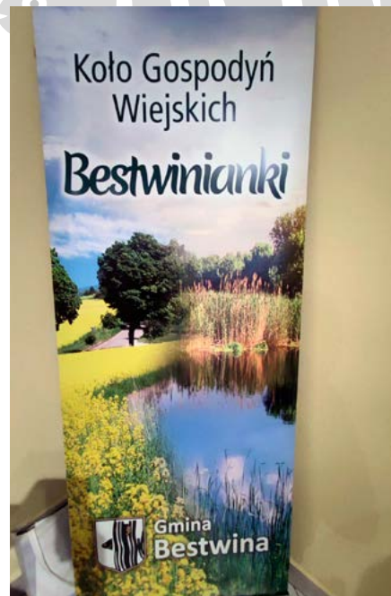
Nowy roll-up „Bestwinianek”