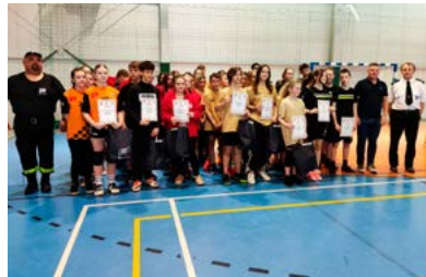
Rozdanie nagród – grupa młodszą

Poziom sportowy należy ocenić jako wysoki, mecze obfitowały w efektowne wymiany piłek, spektakularne asy serwisowe i pady siatkarskie. Organizatorzy i sędzio-